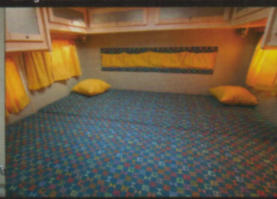
Das Bett lässt sich in zwei Stufen ausziehen.