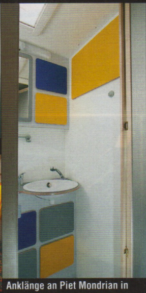
Anklänge an Piet Mondrian in der Nasszelle – aber ohne Rot.