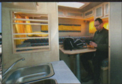
Gut genutzter Platz für zwei Reisende.