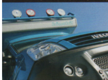
Aufbau und Kabine bilden eine Einheit.